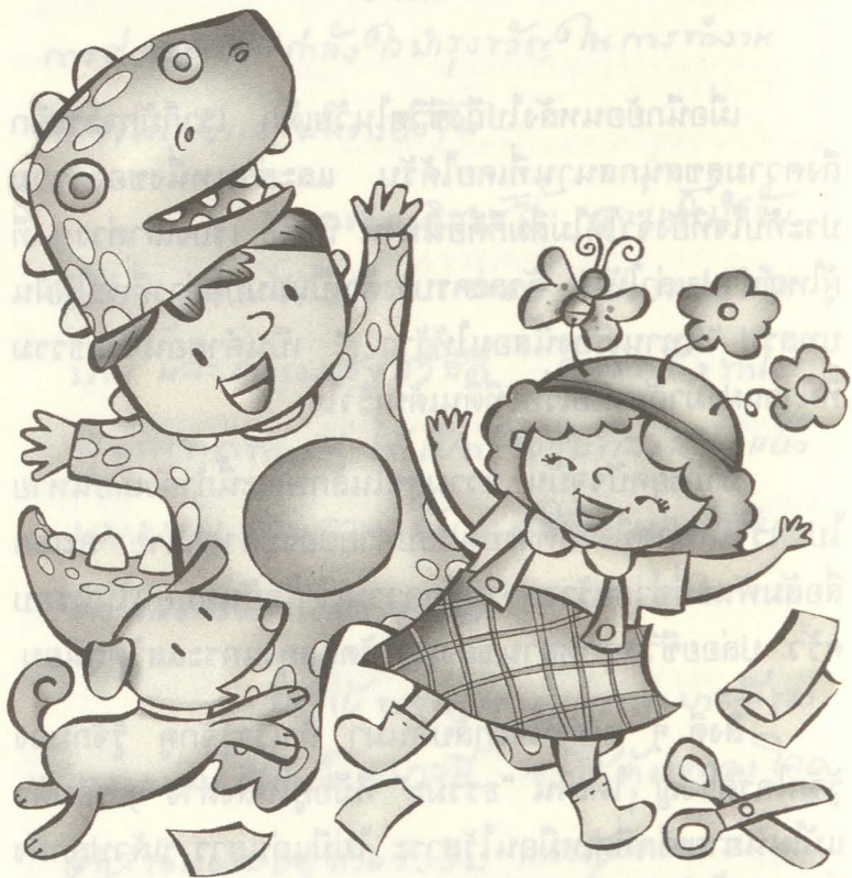
นิทานช่วยส่งเสริมจินตนาการของเด็ก