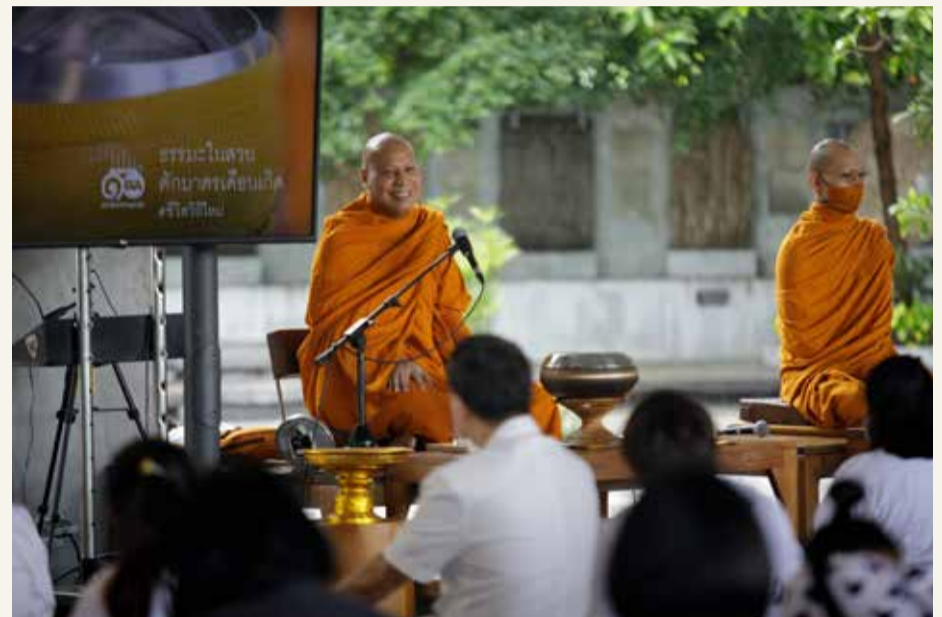
พระเทพศากยวงศ์บัณฑิต (อนิลมาน ฐัมมสากิโย)