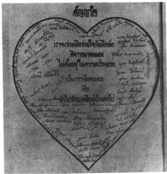
๕. สัจจะวาจา ทำใจให้สงบ และ สัจจะวาจา