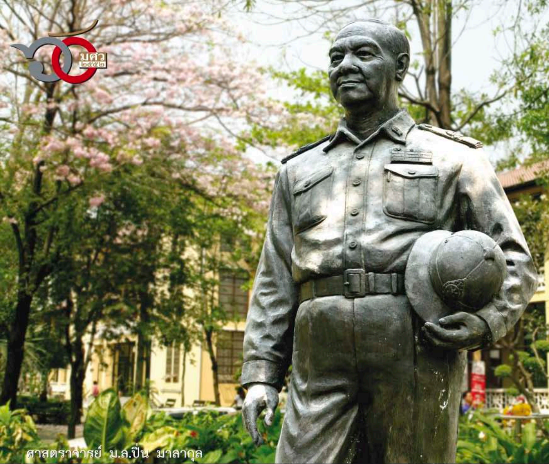
ศาสตราจารย์ ม.ล.ปิ่น มาลากุล