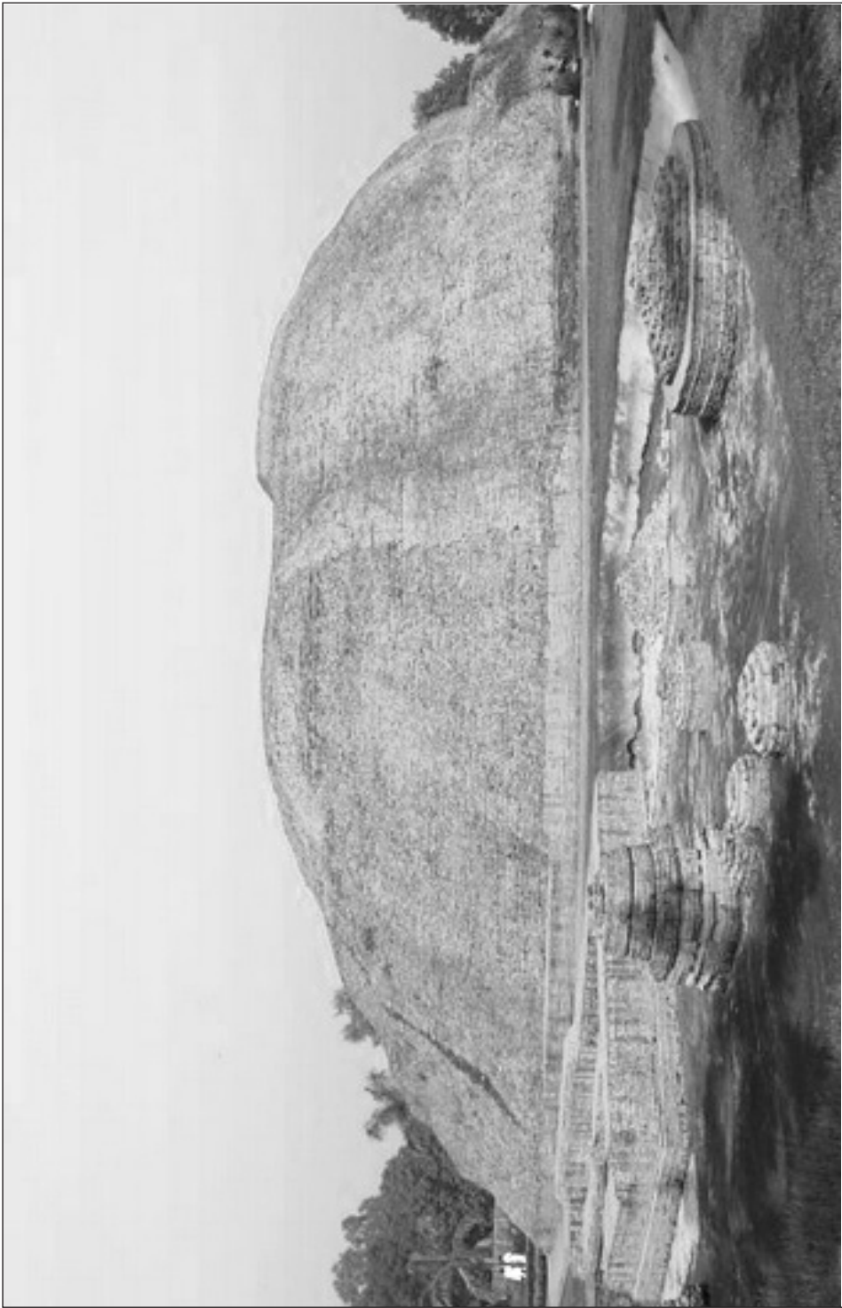
มกุฏพันธเจดีย์ เป็นเครื่องหมายสถานที่ถวายพระเพลิง ที่เมืองกุสินารา (กาเซีย)