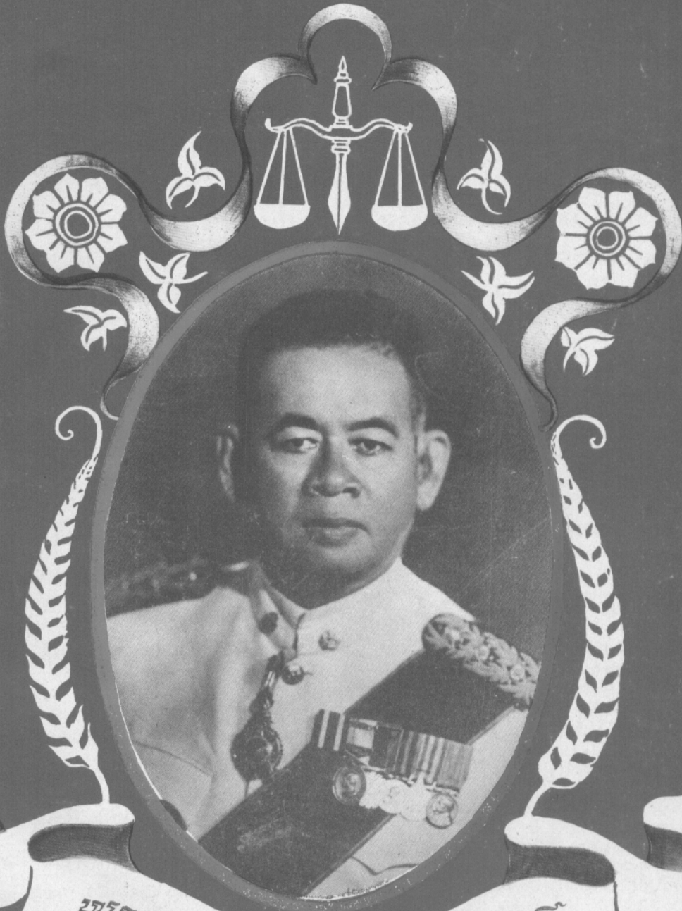
ທະຫານ ສົດໜີ້ຮຽນປະທັບກີ