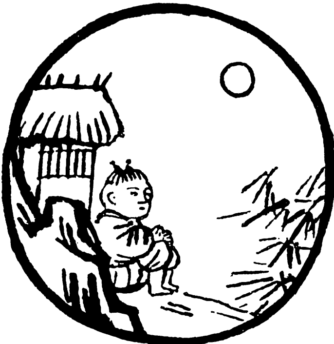
存忘 七 人牛

ภาพที่ ๖ ก็เป่าปี่ ชีว่ว (หรือชีควาย) อยู่บน หลังวัว นี่ คือจุดสูงสุด ของความเป็นกฤหัสถ์ครอง บ้านครองเรือน บริโภค กามารมณ์อย่างถูกต้อง อย่างไม่หลงไหล มีความ สุขสบาย ไม่เดือดร้อนเป็น ไฟ ในอุปมาเหมือนเป่าปี่ ชีว่วไปพลาง.