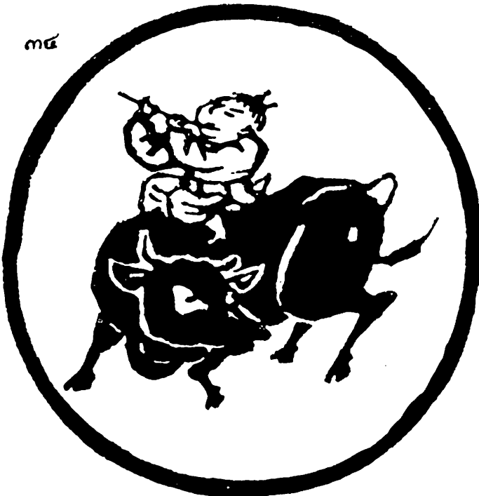
歸驢 六 家牛

ภาพที่ ๖ ก็เป่าปี่ ชีว่ว (หรือชีควาย) อยู่บน หลังวัว นี่ คือจุดสูงสุด ของความเป็นกฤหัสถ์ครอง บ้านครองเรือน บริโภค กามารมณ์อย่างถูกต้อง อย่างไม่หลงไหล มีความ สุขสบาย ไม่เดือดร้อนเป็น ไฟ ในอุปมาเหมือนเป่าปี่ ชีว่วไปพลาง.