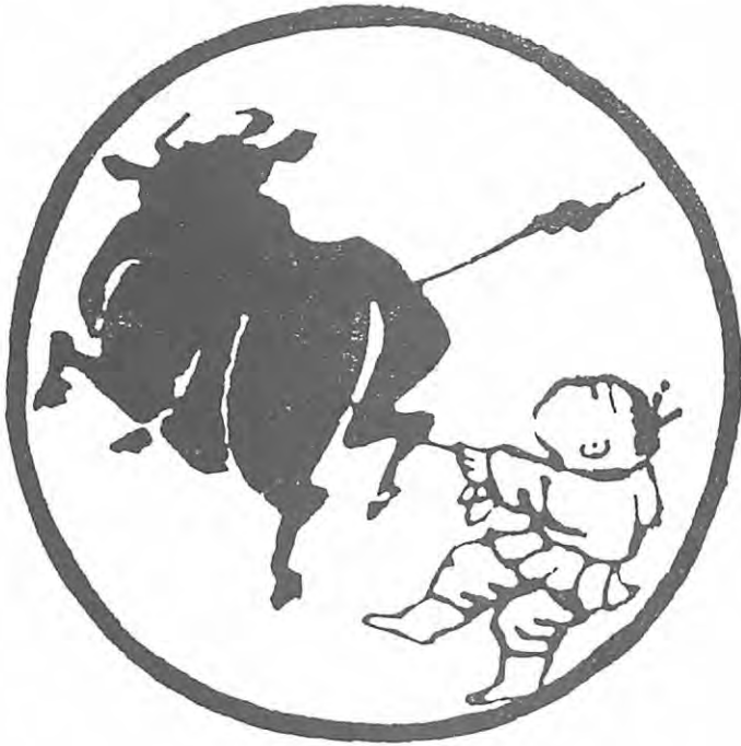
得 四 牛

ภาพที่ ๔ ก็เห็น ตัววัว เหยียดหน้าก้นกับวัว ก็เลยได้ต่อสู้กับวัว เอา เชือกคล้อง แล้วก็ต่อสู้ กันอย่างน่ากลัวอันตราย เปลืองเข้า วัวก็จะขวิดตาย.