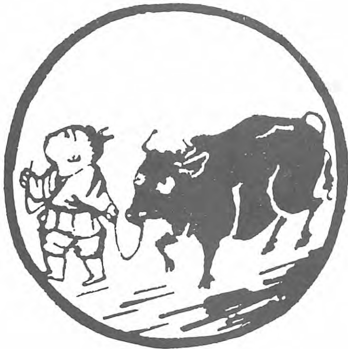
牧 五 牛

ภาพที่ ๔ ก็เห็น ตัววัว เหยียดหน้าก้นกับวัว ก็เลยได้ต่อสู้กับวัว เอา เชือกคล้อง แล้วก็ต่อสู้ กันอย่างน่ากลัวอันตราย เปลืองเข้า วัวก็จะขวิดตาย.