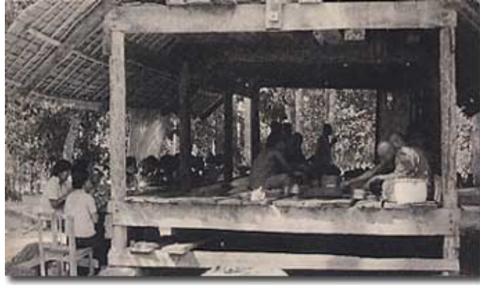
โรงฉันในอดีต พระที่ออกบิณฑบาต จะนำอาหารมาร่วมกันและฉันร่วมกัน

เวลานั้น เราฉันกันแต่เช้าเท่าที่จะทำได้. ผู้สมัครจะฉันคนเดียวก็ฉันเพียงคนเดียว, แต่ผู้ที่บางคราวต้องทำงานออกแรงทางกาย เช่นเกี่ยวกับการจัดสร้างสถานที่ หรือสามเณรรุ่นเล็ก จะฉันเพลด้วยก็ได้ ในเมื่อมีเหตุผลอันควร. ฉันอาหารตามธรรมดา, ตามที่ทายกจะให้. ถ้าใครต้องการจะเว้นอาหารบางอย่าง หรือทดลองการฉันแบบพิเศษออกไป, ต้องหาโอกาสทำเป็นพิเศษ, และเป็นได้เพียงครั้งคราว.