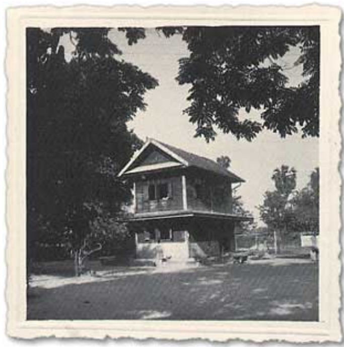
หอสมุดธรรมทานในวัดชยาราม ซึ่งสร้างขึ้นเมื่อปี ๒๔๘๒ ใช้เป็นที่พักของพระมหาเงื่อม ในระหว่างเดินทางจากสวนโมกข์พุมเรียง มาแสดงธรรมที่คณะธรรมทานแห่งใหม่ บริเวณใกล้ทางรถไฟ และใช้เป็นห้องสมุด กับที่ทำงานค้นคว้าของพระมหาเงื่อมด้วย

ที่สวนโมกข์(สวนโมกข์ที่กำลังจัดทำใหม่อีกแห่งหนึ่ง) น้ำดีกว่าที่สวนโมกข์มาก ภูมิประเทศก็เป็นที่รื่นรมย์กว่า เราหวังผลในส่วนนี้ จึงช่วยกันจัดทำขึ้นอีกแห่งหนึ่ง ซึ่งหวังว่าอีกไม่กี่ปีนัก เราจะมีสถานที่ที่สบายกว่าเก่าหลายประการ โดยความช่วยเหลือของธรรมชาติ และมีความหมดเปลืองน้อย.