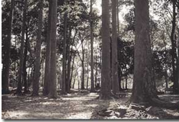
บรรยากาศในสวนโมกข์เก่าที่พุมเรียง

ปราศจากยุ่ง แต่ไม่ปรากฏว่ามีเชื้อมาลาเรีย เนื่องจากเป็นยุทธมดาตัวเล็ก ๆ ซึ่งขึ้นมาจากคลองน้ำเค็มเป็นส่วนมาก. ในกรณีเช่นนี้ต้องเรียนรู้ถึงธรรมชาติของเหล่านี้ รู้จักหลีกเลี่ยงหรือป้องกัน. กลางวันไม่มียุ่งเลย ตอนพลบค่ำจะมีมาก จึงต้องหาวิธีป้องกันไม่ให้ตามขึ้นไปบนที่อาศัย เช่นออกมาเสียหรือไม่เปิดแสงไฟให้เห็นจนกว่าจะค่ำไปมากแล้ว รู้จักแบ่งเวลาการทำงานให้เข้ารูปหรือเหมาะสมกับธรรมชาติ เช่นเวลาที่มียุ่งเช่นนี้ด้วย ในที่สุดก็จะเหมือนกับไม่มียุ่งเหมือนกัน. การตัดตอนหรือป้องกันต้นเหตุ เช่นการระบายน้ำไม่ให้มีที่เกิดของยุ่งก็ช่วยได้มากและเป็นสิ่งที่ควรเอาใจใส่ตามที่ควร. ในบางครั้งยุ่งก็มีประโยชน์ในการช่วยไม่ให้นอนมากเกินไปกว่าธรรมดาหรือเกินความต้องการของร่างกาย.