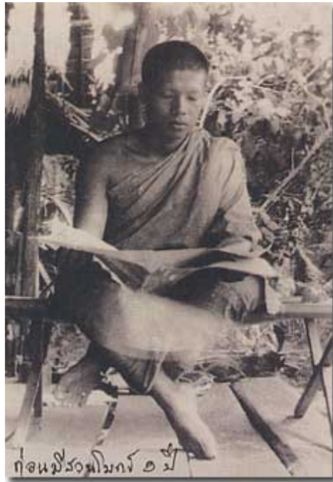
ก่อนสิริวงโมกข์ ๑ ปี