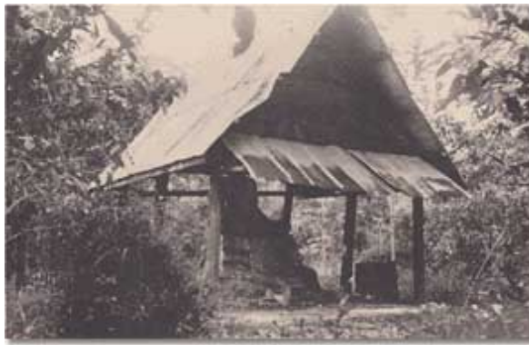
เมื่อย้ายเข้ามาอยู่ในวัดร้างตระพังจิกนั้น คณะอุบาสกได้ช่วยกันสร้างเพิงที่มุงและกันด้วยจาก อยู่หลังพระพุทธรูปเก่าที่หลังคามุงสังกะสีนี้ เพื่อใช้เป็นที่พักของพระมหาเจี๊อม

ข้อที่ควรคิดในเรื่องที่ยอมเสียเวลานำมาเล่าสู่กันฟังนี้ อยู่ตรงที่ว่า การทำอะไรใหม่ ๆ แปลก ๆ ไปจากที่เขากระทำกันอยู่นั้น จะต้องถูกมองในแง่ร้ายบางส่วนหนึ่งเป็นธรรมดา ไม่ว่าผู้ทำจะมีกำลังและอิทธิพลมากหรือน้อย ถ้ามีอิทธิพลมากจะแตกต่างอยู่บ้าง ก็ตรงที่เขาไม่กล้าพูดซึ่งหน้าเท่านั้น เพราะฉะนั้น ผู้ที่คิดจะทำสิ่งหนึ่งสิ่งใด ซึ่งเป็นการปฏิวัติแก้ไขหรือรื้อฟื้นทำให้ดีขึ้น ขออย่าได้ไปเอาใจใส่กับการนิทวารร้ายของผู้เข้าใจผิด ซึ่งโลกนี้จะต้องมีเป็นธรรมดาอยู่แล้ว ทำไปด้วยสุจริตใจก็พอแล้ว ผลจักเกิดขึ้นเท่ากับการกระทำอันบริสุทธิ์ของตน. พวกเรารู้สึกล่วงหน้าไว้เช่นนั้นแล้วเหมือนกัน จึงไม่ได้เอาใจใส่อะไรมากไปกว่าความนึกสนุกสนานของผู้ที่ทํานายสิ่งใดไว้แล้ว สิ่งนั้นก็เกิดขึ้น เพื่อให้ตนกลายเป็นหมอดูที่ทํานายแม่น ๆ เท่านั้น.