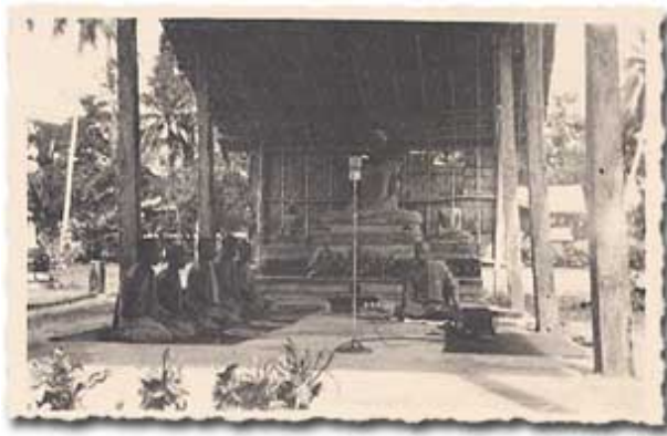
ภาพหนึ่งของการตระเวนเทศน์ในท้องถิ่น ระหว่างปี ๒๔๙๐-๒๔๙๑ พุทธทาสภิกขุ และคณะธรรมทาน จัดหน่วยเผยแผ่เคลื่อนที่โดยทางเรือ เปิดงานเสียงธรรมะเทศน์ไปตลอดทาง และบางครั้งก็ขึ้นบกแสดงธรรมกับประชาชนในอำเภอต่างๆ

การไม่ได้หัวเราะเสียเลย หรือไม่มีเวลารู้สึกสนุกเพลิดเพลินเสียเลยนั้น คงจะทำให้เส้นประสาท หรือกล้ามเนื้อบางส่วนแห่งตึบ และกลายเป็นคนไม่สมประกอบไปบางส่วนก็เป็นได้ หรือจะเปิดโอกาสให้แก่โรคภัยบางอย่างโดยตรงก็ได้. ฉะนั้นแม้ในวงผู้ฝึกฝนการปฏิบัติธรรม ก็จะต้องแก้ปัญหาเรื่องนี้ให้ลุล่วงไปด้วยดีเหมือนกัน, จะถือว่า เป็นสิ่งนอกเรื่องไม่ได้. ผลของการเป็นอยู่ในสำนักบางสำนัก ปรากฏเป็นการเจ็บไข้, การวิกลจริต, และความคิดนึกที่แคบไม่สมบูรณ์ไปเสียนั้น ฉันเห็นว่าอาจมีขึ้นเพราะการละเลยในเรื่องนี้เสียเกินไป ไม่มากก็น้อย. เพื่อนนักศึกษา หรือผู้จะจัดตั้งสำนักศึกษาตามแบบนี้ ควรนึกดูให้ดีด้วย.