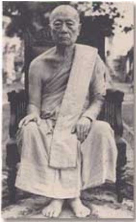
สมเด็จพระพุทธโฆษาจารย์ (เจริญ ญาณวโร)

เพราะมูลเหตุสำคัญดังกล่าวมา จึงทำให้บุคคลผู้มีวิญญูญาณแห่งการปฏิบัติบวชน้อยตัว, เมื่อมีน้อยตัว ก็เป็นธรรมดาอยู่เองที่ผู้ที่จะก้าวไปได้ย่อมน้อยไปกว่านั้นอีก หรืออาจถึงกับไม่มีเสียเลยก็ได้. เพราะฉะนั้น สำนักปฏิบัติธรรมต่าง ๆ ที่ใครจัดขึ้นหรือกำลังจะจัดขึ้นก็ตาม ถ้าปรากฏว่าหานักปฏิบัติได้น้อยเกินไปหรือไม่ได้เสียเลย ก็ไม่ควรประหลาดใจหรือเสียใจ, อย่างน้อยที่สุด การที่มีสถานที่ว่าง ๆ ไว้ ก็เป็นเครื่องมืออันหนึ่ง ที่เราใจให้นักศึกษาหนุ่มผู้กล้าหาญ เกิดความกล้าขึ้นในวันหนึ่ง และเป็นเครื่องกันล้มพระศาสนาในด้านนี้ ได้เป็นอย่างดี, ถ้ายังเป็นสำนักที่อุณหนาฝ้าคั่งไปด้วยนักปฏิบัติไม่ได้ ก็เป็นเพียงสำนักที่นัดพบของนักคิดอิสระหรือผู้ที่กำลังเตรียมตัวเพื่อเป็นนักปฏิบัติไปพลาง ก็ได้ผลคุ้มกันเหลือหลาย. หรืออย่างน้อยที่สุด ก็เป็นสถานที่นัดพบเพื่อศึกษาเป็นครั้งคราวของผู้ใฝ่ฝันในความสงบได้ดี ซึ่งก็มีผลมากเหมือนกัน.