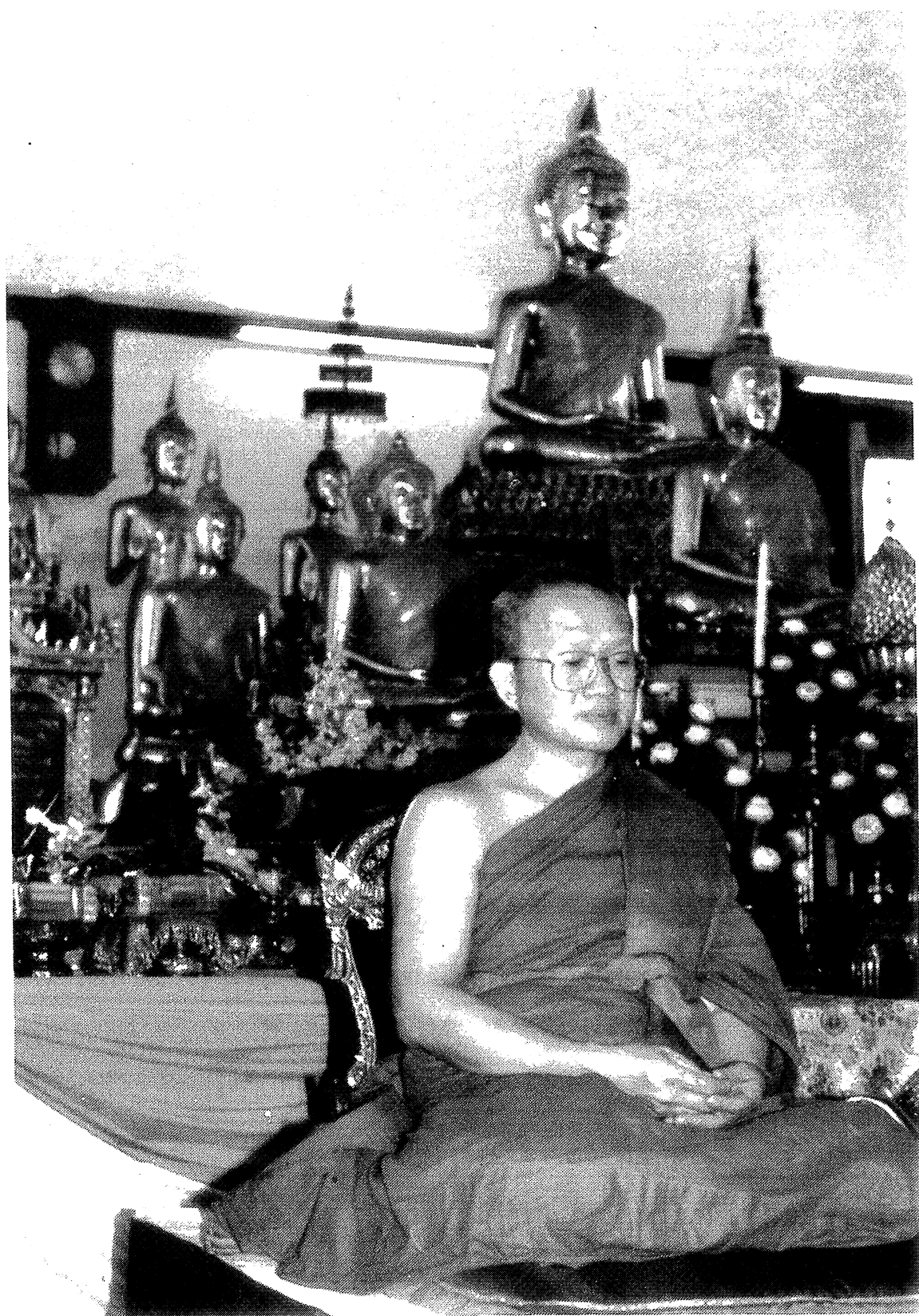
พระเทพเวที (ประยูร ปยุตโต)